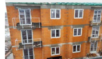
Książenice k. Radziejowic. Osiedle mieszkaniowe.