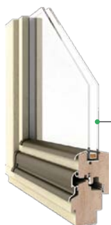
Classic DJ 68