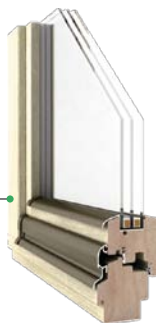
Comfort DJ 78