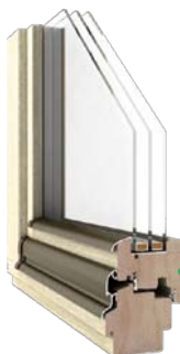
Premium Thermo DJ 92