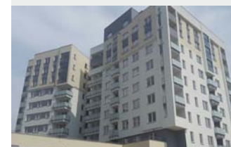
Warszawa - Goćław. Osiedle mieszkaniowe.