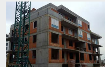
Warszawa - Goćław. Osiedle mieszkaniowe w trakcie realizacji 650 szt. okien z montażem.